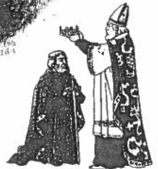
Le pape Léon III couronne Charlemagne empereur.

Charlemagne fit régner la terreur en Saxe : il y imposa un régime très sévère, toute atteinte à l'autorité du roi, de ses agents ou des prêtres était punie de mort. Dans les années 790, il ordonna aussi de déporter en Gaule certaines populations, pour venir à bout des plus rebelles.