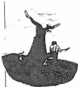
LA DESTRUCTION DE L'IRMINISUL