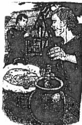
Ce commerçant pèse la monnaie de son client pour en vérifier la valeur.

C'est une période culturelle tellement importante pour la France qu'on appelle ce moment la renaissance carolingienne.